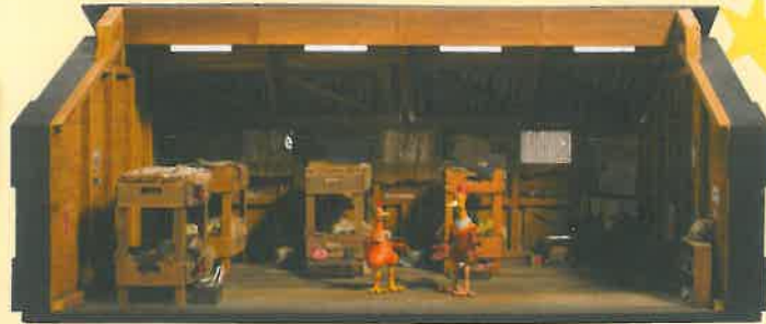
▲「チキンラン」セット