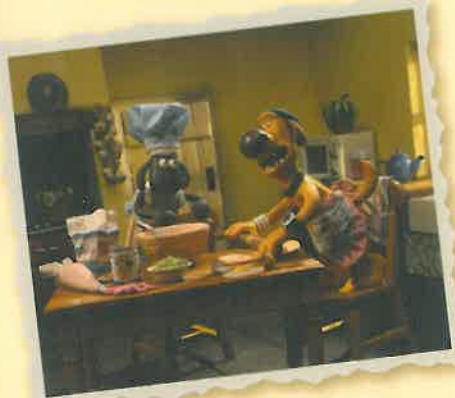
▲「ひつじのショー」テレビシリーズセット