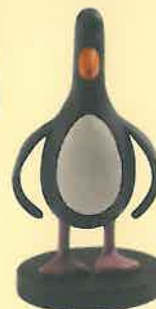
▲「ウォレスとグルミット」ペンギンに気をつける! マックロウパペット