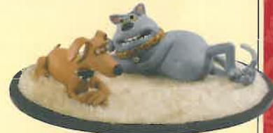
▲『おすすめ生活』パペット