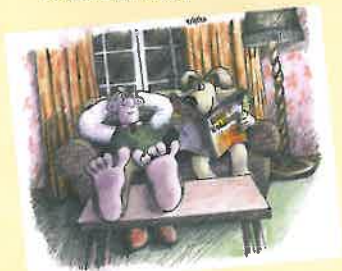
▲『ウォレスとグルミット チーズ・ホリデー』カラースケッチ (ニック・パーク監督)