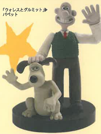
▲「ウォレスとグルミット」パペット